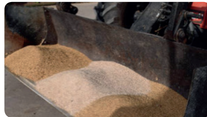
SCHRITT 1 - Proteine