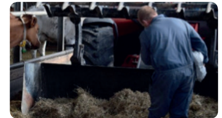
SCHRITT 3 - Struktur (Heu)