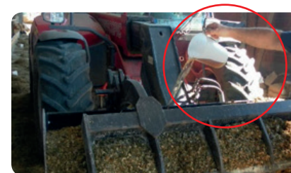
SCHRITT 5 - Mais + ACSS vor dem Hinzufügen zum TMR Wagen