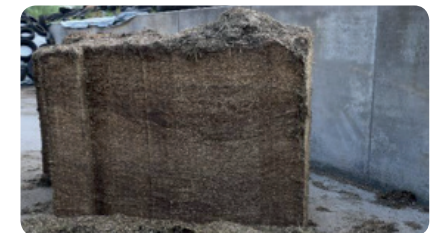
SCHRITT 6 - Gras