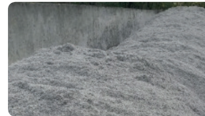
SCHRITT 2 - Brei