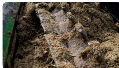
SCHRITT 7 - 10 Minuten lang mischen