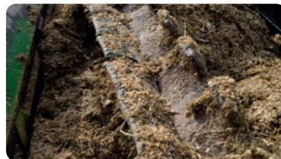
SCHRITT 4 - Anmischen