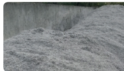
PASO 2 - Pulpa