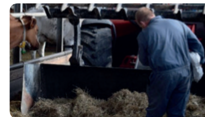
PASO 3 - Estructura (Heno)