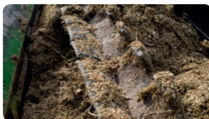
PASO 7 - Mezclar 10 minutos