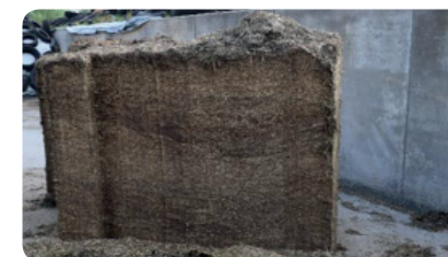
PASO 6 - Hierba