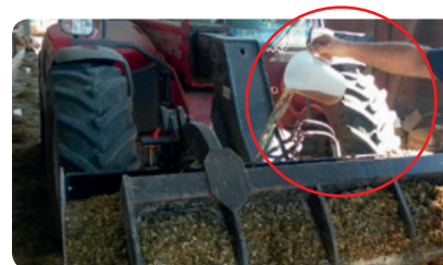
PASO 5 - Mais + Agrocid Super Sil