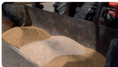
PASO 1 - Proteínas