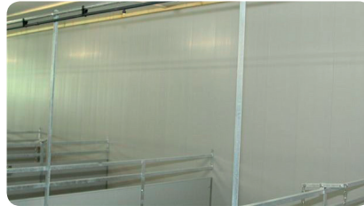
STEP 1 Einweichen mit Wasser.