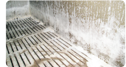
STEP 3 Einwirkzeit (10-60min).