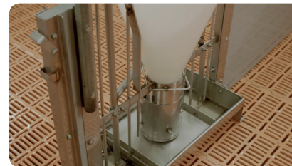
STEP 5 Entwässern und Säubern der Futter- und Tränkeeinrichtungen.