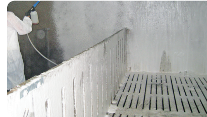
STEP 2 Einschäumen mit Hochdruck Schaumlanze (50-150 bar).