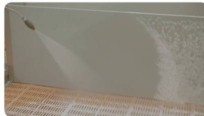
STEP 4 Reinigung mit Hochdruckreiniger (50-150 bar).