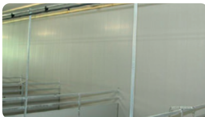
ШАГ 1 Намочите водой.