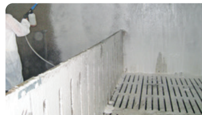
ШАГ 2 Нанесите гель с помощью пенной насадки под высоким давлением (50-150 бар).