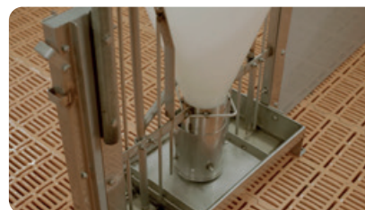
ШАГ 5 Опустошите кормушки / поилки, пока не будет удалена вся вода и грязь..