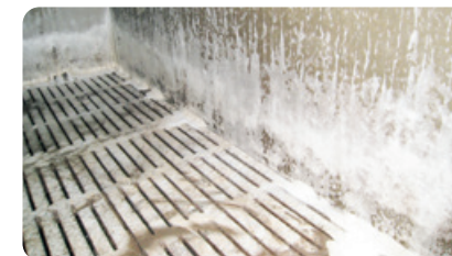
ШАГ 3 Время контакта (10 - 60 мин).