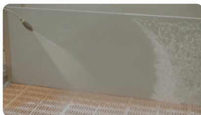
ШАГ 4 Смыть напором воды под высоким давлением (50-150 бар).