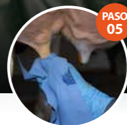
PASO 05 LIMPIAR/SECAR