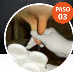
PASO 03 TESTE TCM