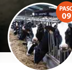
PASO 09 DESPUÉS DEL ORDENO...