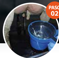
PASO 02 DESPUNTE