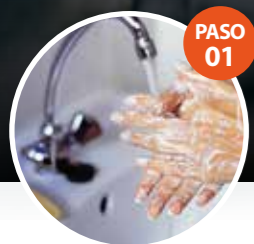
PASO 01 HIGIENE DE LAS MANOS